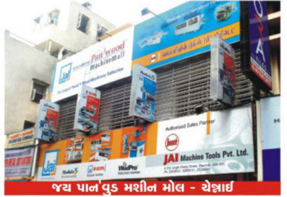
જય પાન વુડ મશીન મોલ - ચેન્નાઈ